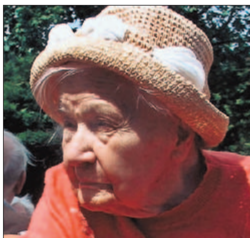
... des Genießens kleiner Augenblicke