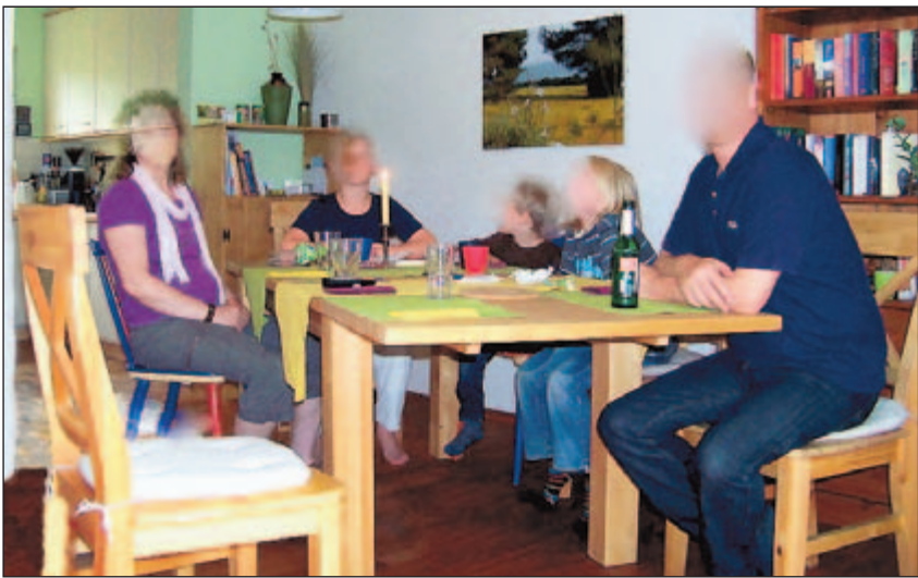
... des Nicht-mehr-Erkennens vertrauter Menschen