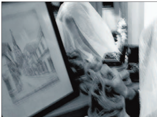
... des Erscheinungsbilds