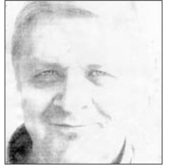
... des langsamen Entschwindens ... und dessen, was bleibt