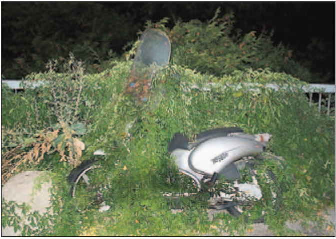
... des Vergessen-Werdens