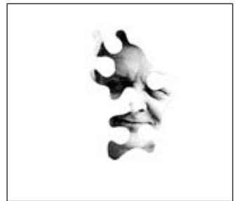
... immer größer werdender Lücken ... und dem, was bleibt