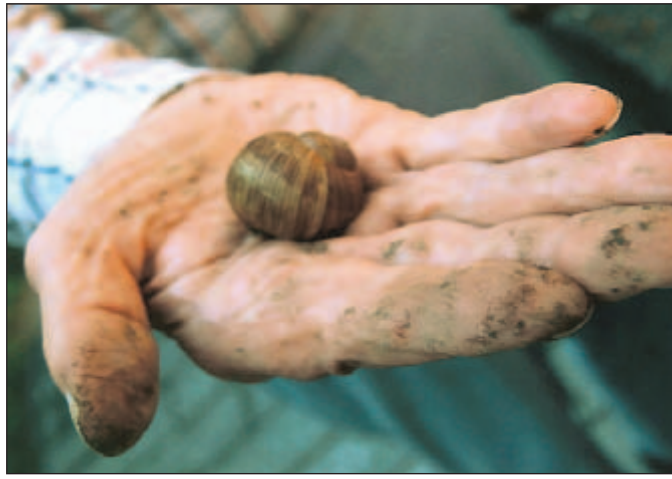
... der Erinnerung