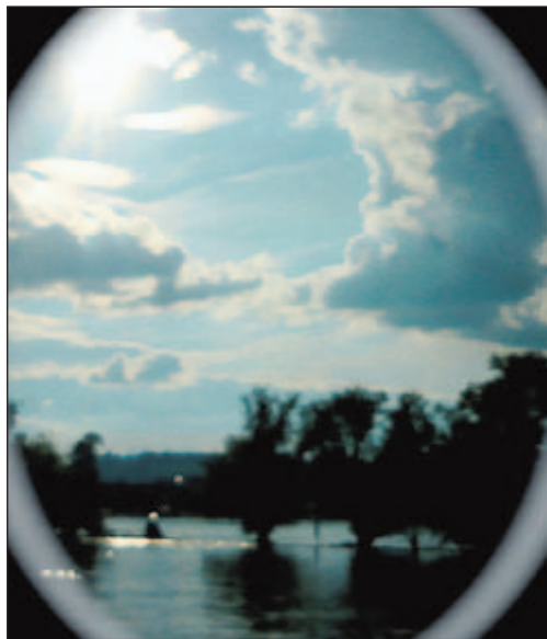
... der Wahrnehmung