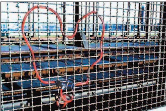
... der Suche nach dem Schlüssel zum Herzen