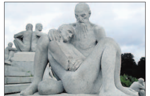
... gemeinsamen Tragens