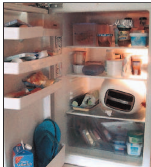
... der Gelassenheit