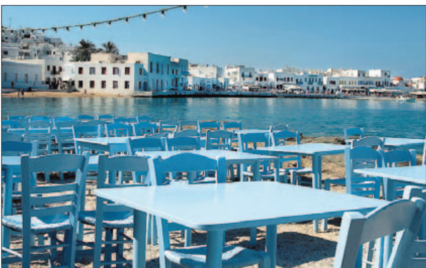
... des Sich-bemerkbar-Machens