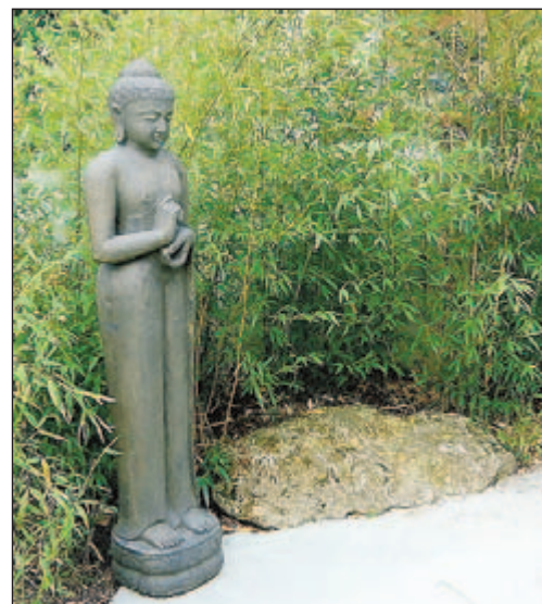
... des Bewahrens der eigenen Kräfte